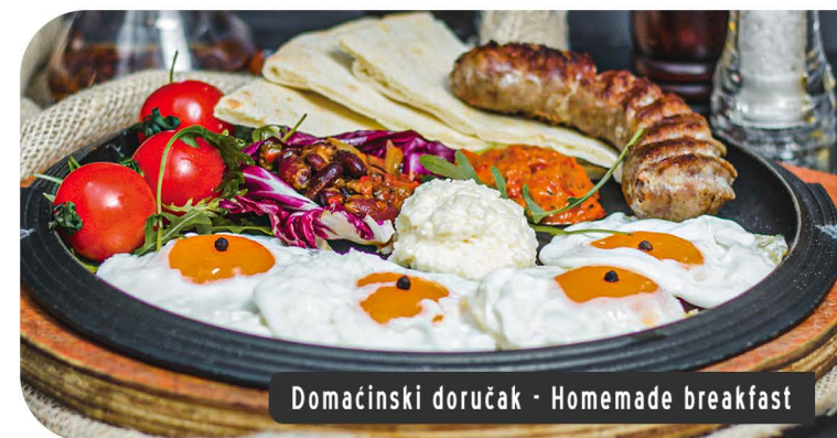
Domaćinski doručak - Homemade breakfast