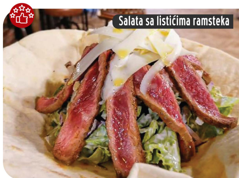
Salata sa listićima ramsteka