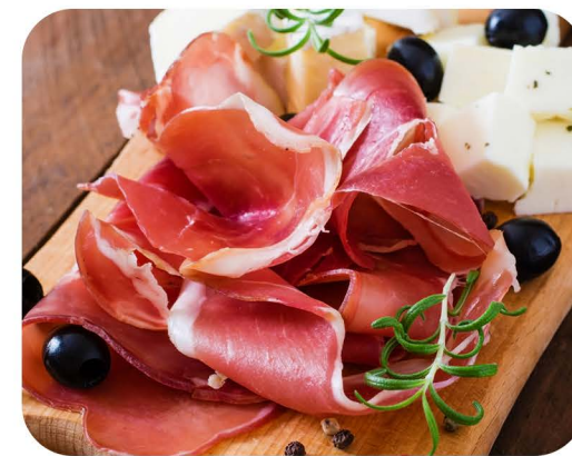
Crostini 4 u porciji