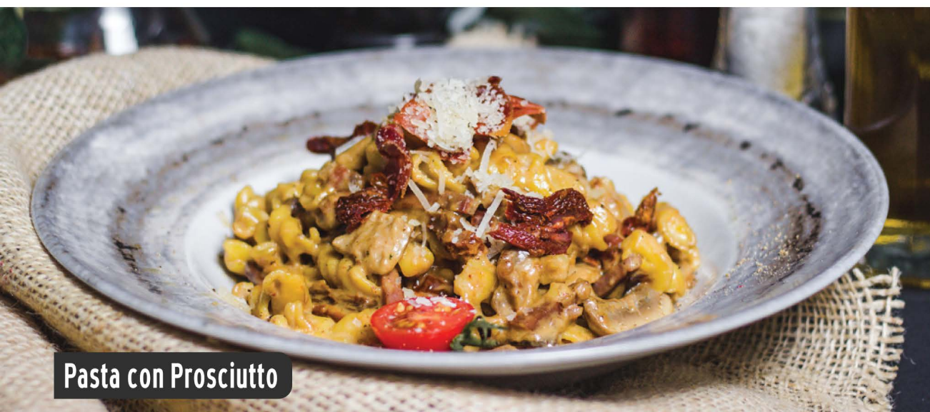
Pasta con Prosciutto