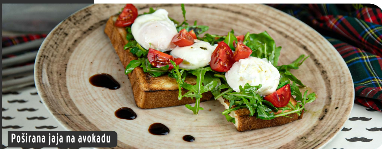
Poširana jaja na avokadu