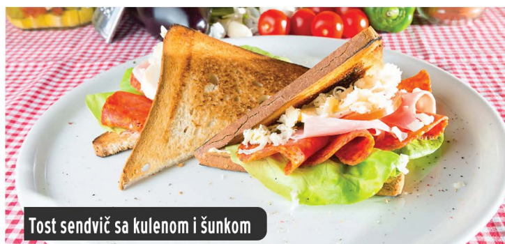
Tost sendvič sa kulenom i šunkom