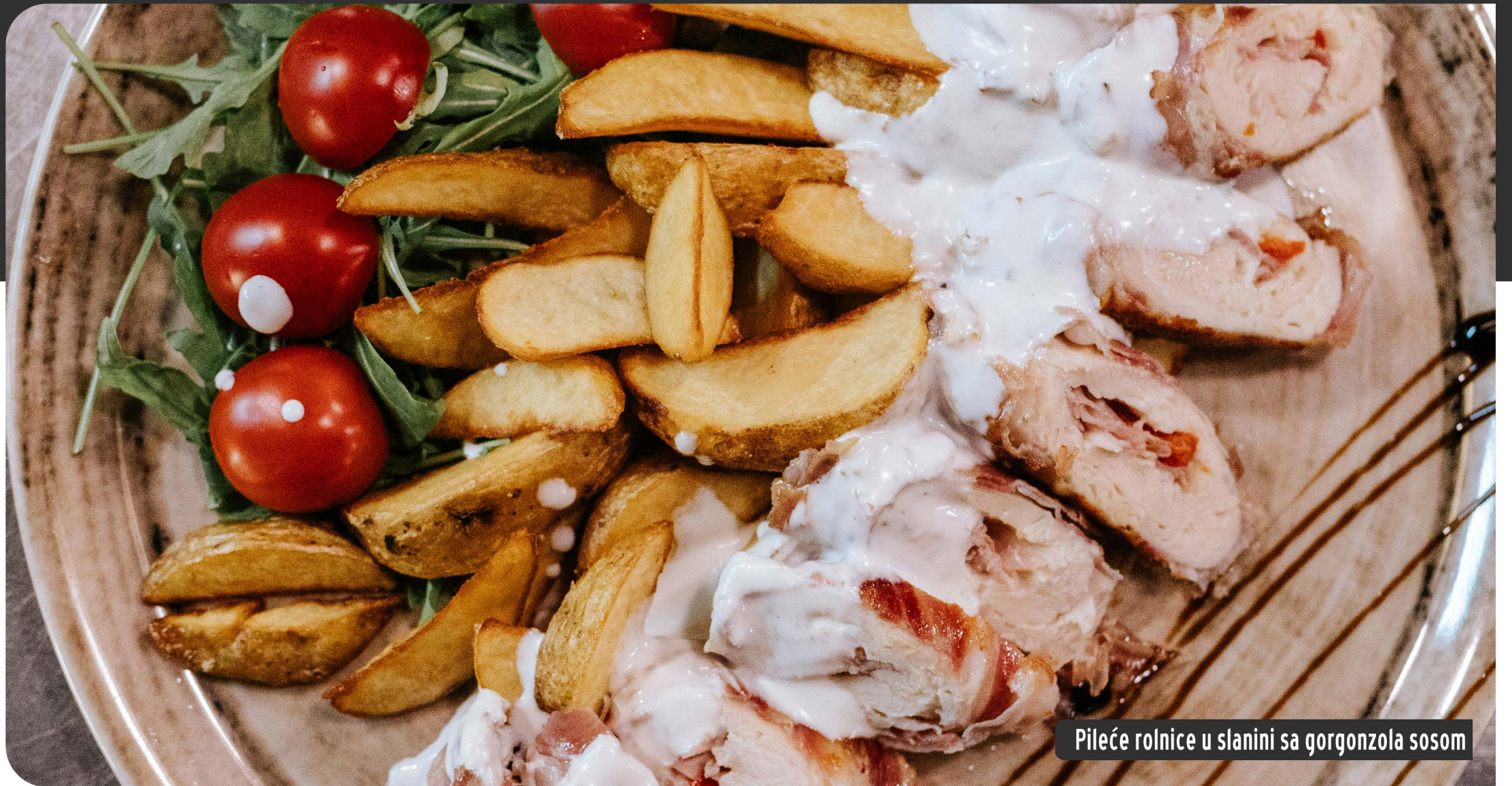
Pileće rolnice u slanini sa gorgonzola sosom