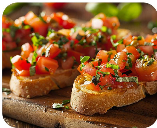
4 bruskete u porciji