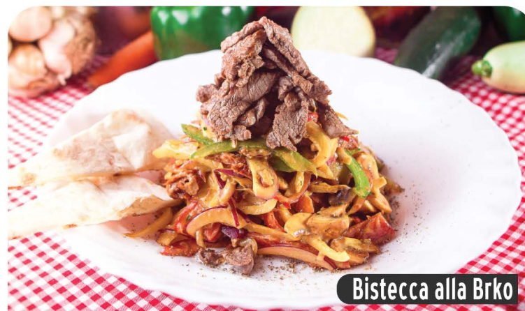
Bistecca alla Brko