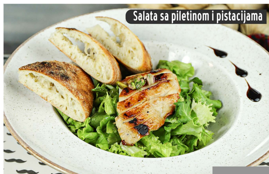
Salata sa piletinom i pistacijama