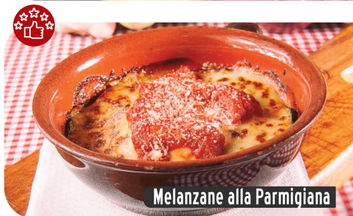
Melanzane alla Parmigiana