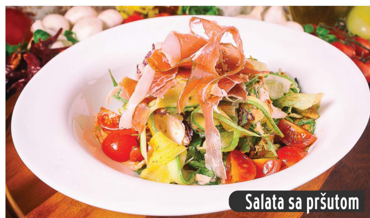
Salata sa pršutom